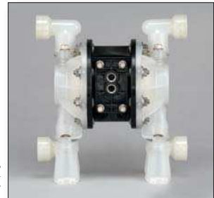
PE05P-APS-PAA-BOS + 637440-X